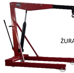
SERIA „L” ŻURAWIE BEZ SKŁADANIA