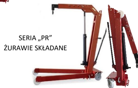
SERIA „PR” ŻURAWIE SKŁADANE