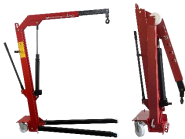
SERIA „P” ŻURAWIE SKŁADANE